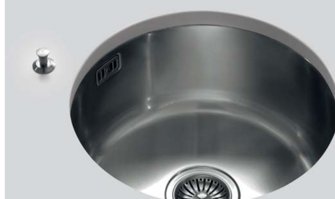
CO Ø 25 Colapasta S Ø 26 Scolapiatti T Ø 26 Tagliere CS Ø 24 Cestello CO Ø 25 Colander S Ø 26 Draining-board T Ø 26 Chopping-board CS Ø 24 Basket