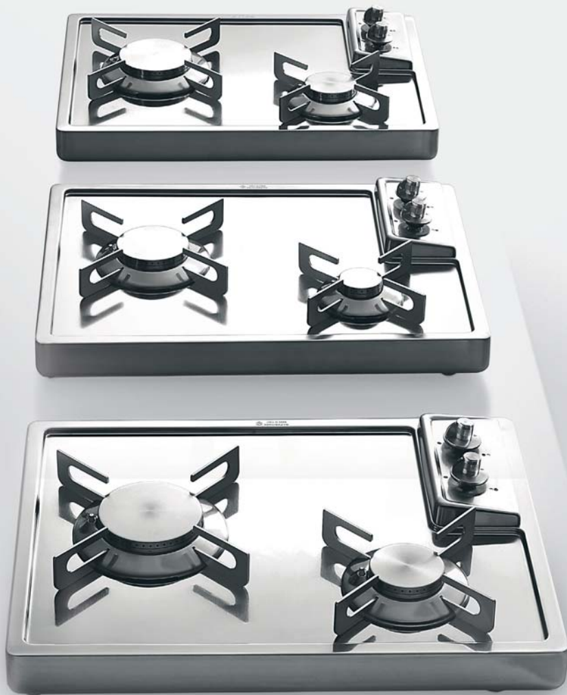
A 538/2GG e 2GR Piani cottura da appoggio a due fuochi gas, larghi cm 38 A 538/2GG and 2GR Countertop hobs with two gas burners, 38 cm wide

Profondità Depth cm 50 Larghezza Width cm 29-38-48-58-68-78-88 Altezza Height cm 5