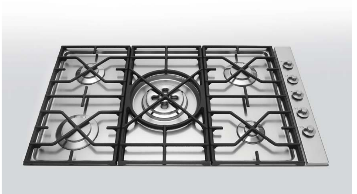
5698/4GTC-CL Piano cottura da incasso a cinque fuochi gas, tripla corona Dual, griglia in ghisa e comandi laterali, largo cm 98 5698/4GTC-CL Built-in hob with five gas burners, Dual triple crown burner, cast iron grid and side control knobs. Depth 98 cm