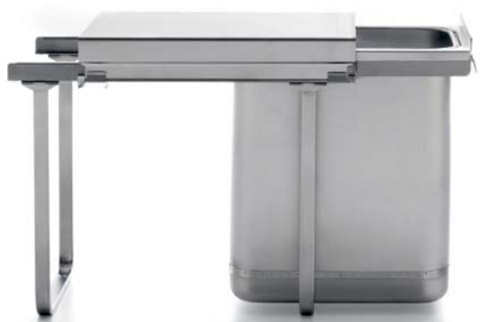
PMR 39/2B Width 39 cm 12+19 Litres