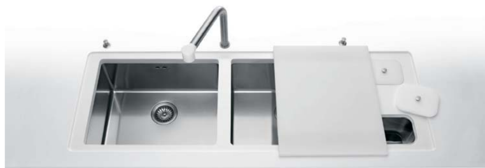
VSR 50 + VSR 50 Due vasche sottopiano larghe cm 50 PMR/158A Kit pattumiere alte per base con ante PMR/158C Kit pattumiere basse per base con cassetti VSR 50 + VSR 50 Two undermount bowls 50 cm wide PMR/158A Kit of tall waste bins for furniture with doors PMR/158C Kit of low waste bins for furniture with drawers