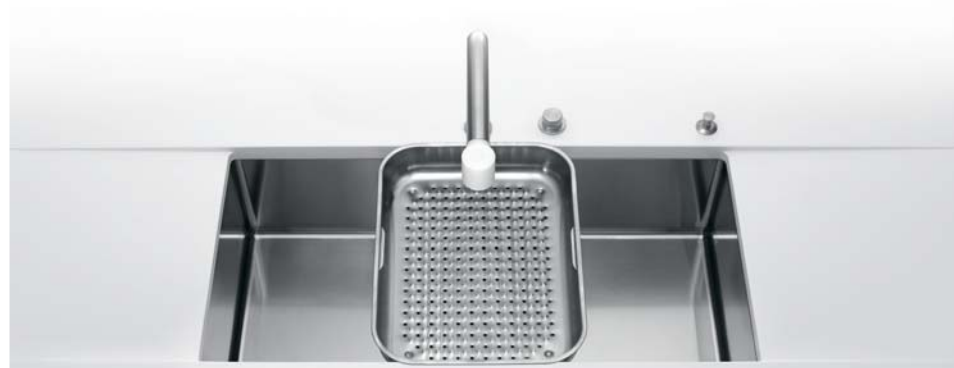
VSR 70 Vasca sottopiano larga cm 70. BF 10 Bacinella forata VSR 70 Undermount bowl 70 cm wide. BF 10 Basin with holey bottom