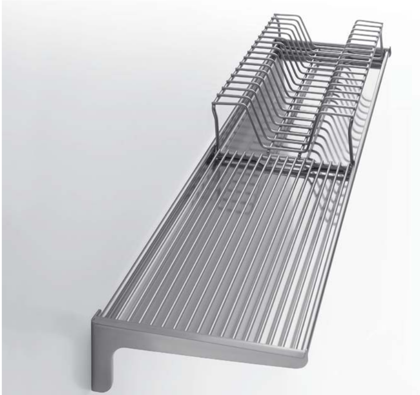
SP 99 Portapiatti largo cm 99 SP 99 Plate rack 99 cm wide

Una mensola inox da usare come portapiatti, porta bicchieri, porta oggetti. I portapiatti sono composti da staffe, vassoio raccogli gocce, griglia orizzontale e griglia verticale, sono costruiti in acciaio inox aisi 304 con satinatura argento. A stainless steel rack for plates, glasses and other objects. The racks, consisting of brackets, drip trays, a horizontal support and a vertical support, are made of Aisi 304 stainless steel with silver satin finish.