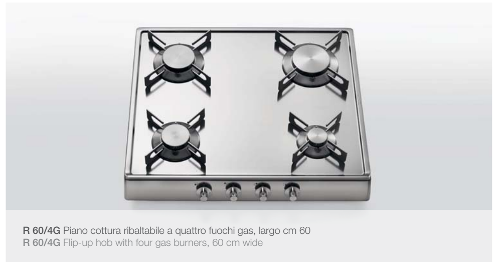
R 60/4G Piano cottura ribaltabile a quattro fuochi gas, largo cm 60 R 60/4G Flip-up hob with four gas burners, 60 cm wide

La posizione verticale libera lo spazio dedicato alla cottura. Un grande vantaggio per chi ha problemi di spazio. R 30/2GG e 2GR piani cottura ribaltabili a due fuochi gas, larghi cm 30 The vertical position frees up work space. A great advantage in situations of space shortage. R 30/2GG e 2GR Flip-up hobs with two gas burners, 30 cm wide