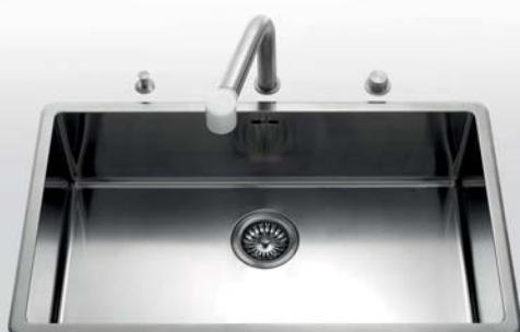
VFR 475 Vasca da incasso larga cm 75,5 VFR 475 Built-in bowl, 75,5 cm wide

Il pomello di apertura/chiusura del tappo va posizionato sul top della cucina. The control knobs for opening/closing the plug must be fitted on the kitchen countertop.