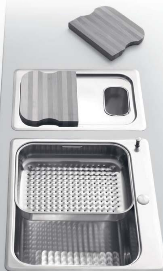
VERSIONE DA INCASSO SEMIFILO F 534/2B Unità raccolta differenziata da incasso semifilo a due contenitori da litri 12+19 BUILT-IN VERSION F 534/2B Built-in waste sorting units with two bins of 12+19 litres