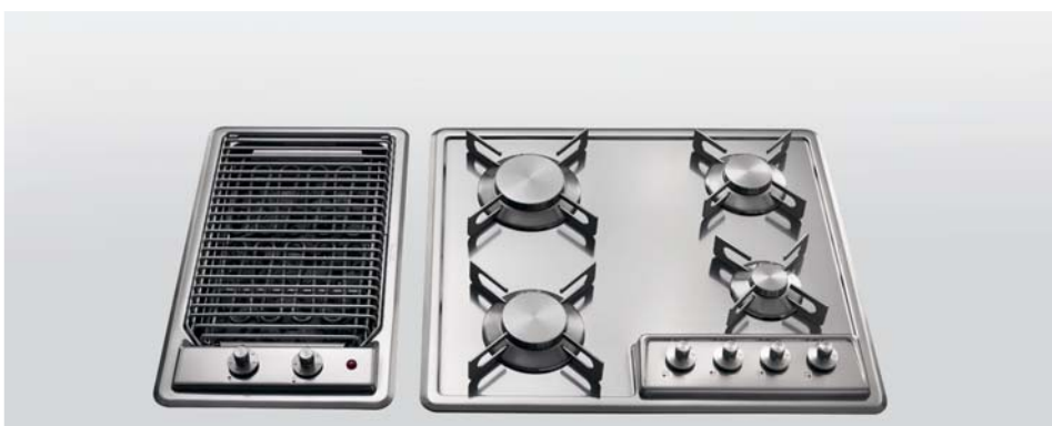
F 530/GE Grill elettrico da incasso, largo cm 30 F 559/4G Piano cottura da incasso a quattro fuochi gas, largo cm 59 F 530/GE Built-in electric grill, 30 cm width F 559/4G Built-in hobs with four gas burners, 59 cm wide