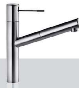
10.151.113.700 ONO Miscelatore monocomando con canna orientabile e doccino estraibile 10.151.113.700 ONO Mixing tap with integrated control, adjustable spout and pull-out spray