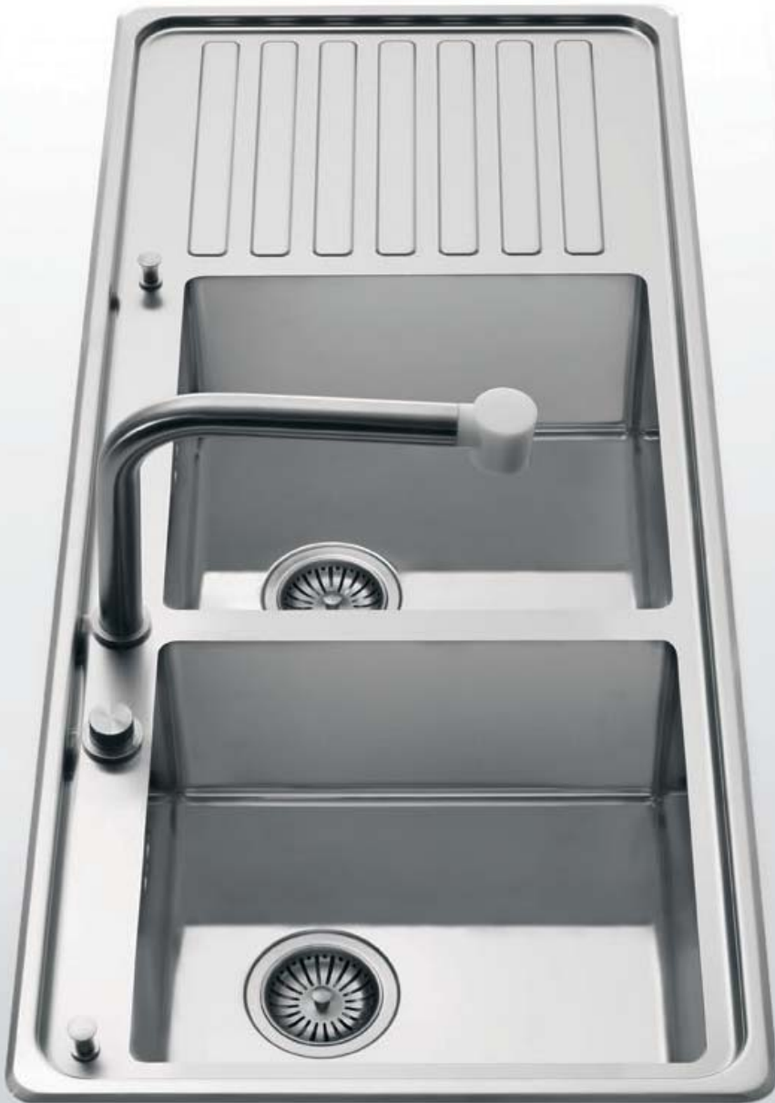
LFRS 5117/2V1S Lavello semifilo a due vasche con scivolo, largo cm 117 LFRS 5117/2V1S Built-in sink with two bowls and one draining-board, 117 cm wide

Modelli a una o due vasche, bacinella predisposta per tritarifiuti, scivolo inclinato liscio o disegnato (destra o sinistra), bordo interno con salvagocce, pomelli di apertura/chiusura tappo. The models may have one or two bowls, a small basin suitable for the waste disposal unit, a flat or ribbed draining-board to the right or left, a no-drip edge and the plug control knobs.