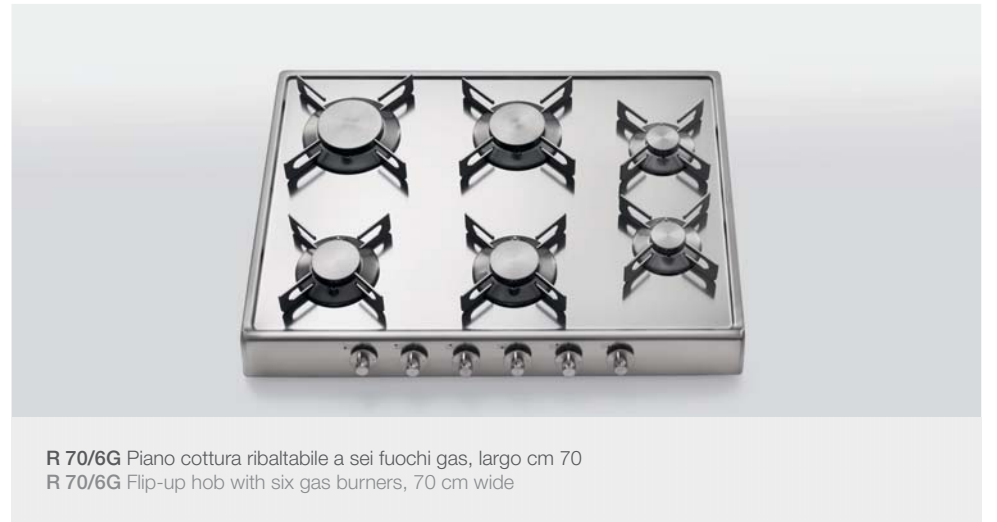
R 70/6G Piano cottura ribaltabile a sei fuochi gas, largo cm 70 R 70/6G Flip-up hob with six gas burners, 70 cm wide