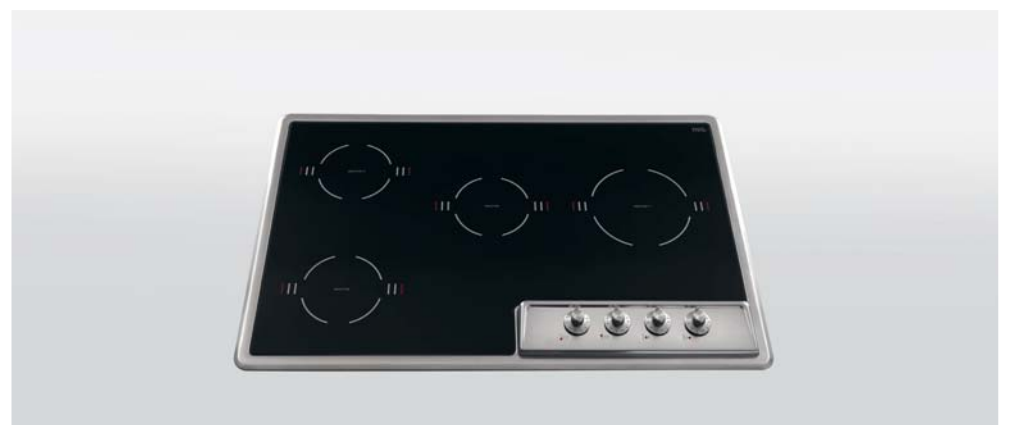
F 579/4EI Piano cottura da incasso a induzione con quattro zone cottura, largo cm 79 F 579/4EI Built-in induction hob with four cooking zones, 79 cm width

Area cottura organizzata con quattro fuochi diversi per cotture specifiche e differenziate.