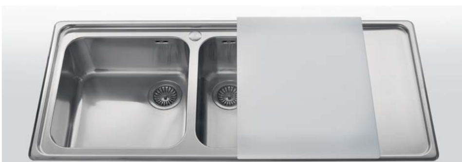
Taglieri in polietilene per i vari tipi di vasche e lavelli. Profondità cm 44 - 50. Larghezza cm 38 - 40 Polyethylene chopping-boards for different types of bowls and sinks. Depth 44 - 50 cm - Width 38 - 40 cm