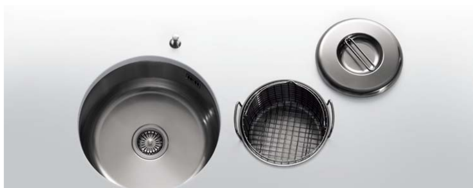
VS 40-D Vasca tonda da sottopiano Ø 40. VDS 25 Vaschetta da sottopiano Ø 25 predisposta per tritarifiuti. TE Ø 25 Tegame con coperchio. CS Ø 24 Cestello inox VS 40-D Undermount round bowl Ø 40. VDS 25 Small undermount bowl Ø 25 suitable for the garbage disposal. TE Ø 25 Pan with lid. CS Ø 24 Stainless steel wire basket

Ø 25 - 35 - 40 - Altezza cm 18 Ø 25 - 35 - 40 - Height 18 cm