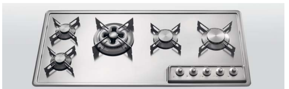
F 499/4GTC Piano cottura da incasso a cinque fuochi gas, largo cm 99 F 499/4GTC Built-in hob with five gas burners, 99 cm wide