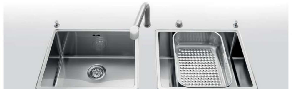
VFR 455 + VFR 455 Due vasche da incasso larghe cm 55 BF 10 Bacinella forata VFR 455 + VFR 455 Two built-in bowls, 55 cm wide BF 10 Basin with holey bottom