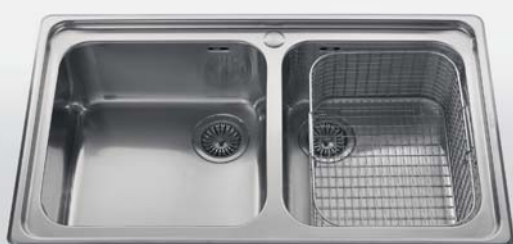
87/2V Lavello da incasso a due vasche, largo cm 87 87/2V Built-in sink with two bowls, 87 cm wide