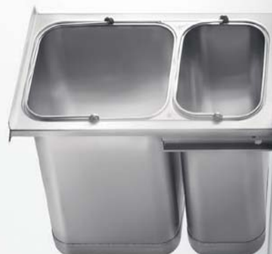
Profondità Depth cm 51 Larghezza Width cm 34 Altezza Height cm 53