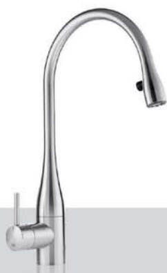
10.111.103.700 EVE Miscelatore inox monocomando con canna orientabile e doccino estraibile. 10.111.103.150 Nel colore bianco 10.111.103.700 EVE Mixing tap with integrated control, adjustable spout and pull-out spray. 10.111.103.150 In white colour