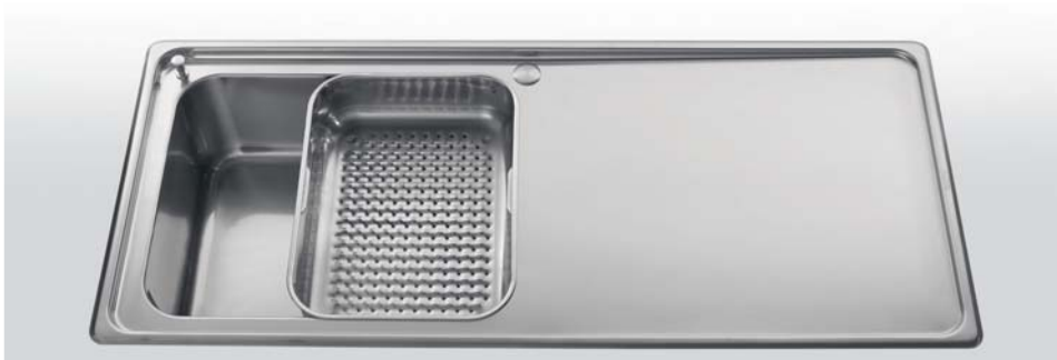
BF10 Bacinelle inox con fondo forato. Profondità cm 41 - Larghezza cm 31 - Altezza cm 10 BF10 Stainless steel basins with holey bottom. Depth 41 cm - Width 31 cm - Height 10 cm