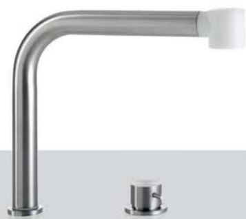
MCR 25 Canna orientabile totalmente estraibile con doccino in Derlin® bianco e CRL comando remoto MCR 25 Fully extractable spout of the tap with pull-out spray in white Derlin® and CRL remote control