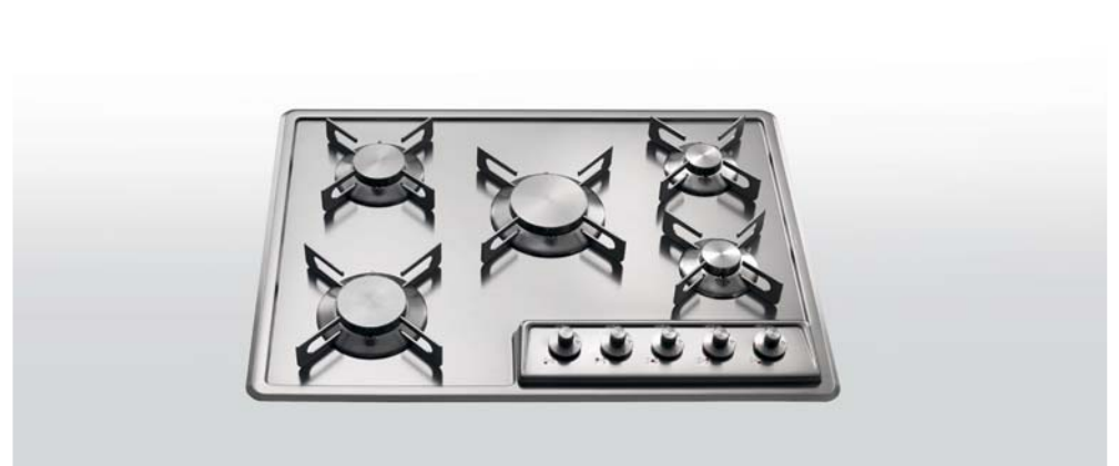
F 569/5G Piano cottura da incasso a cinque fuochi gas, largo cm 69 F 569/5G Built-in hob with five gas burners, 69 cm wide