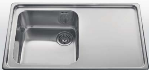
87/1V1SL Lavello da incasso ad una vasca e uno scivolo liscio, largo cm 87 87/1V1SL Built-in sink with one bowl and one flat draining-board, 87 cm wide

Modelli a una o due vasche, scivolo liscio destro o sinistro, bordo interno con salvagocce. Models may have one or two bowls with left or right flat draining-board, no-drip edge.