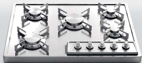
A 568/5G Piano cottura da appoggio a cinque fuochi gas, largo cm 68 A 568/5G Countertop hob with five gas burners, 68 cm wide