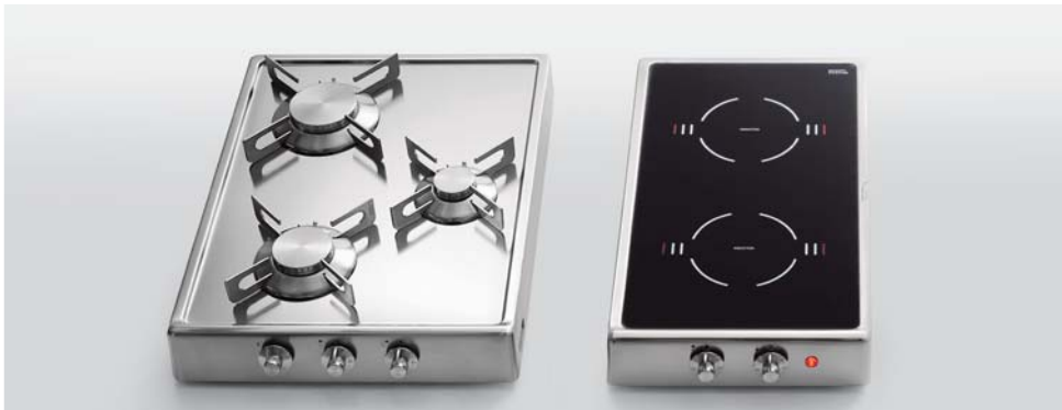
R 40/3G Piano cottura ribaltabile a tre fuochi gas, largo cm 40 R 30/2EI Piano cottura ribaltabile a induzione a due zone cottura, largo cm 30 R 40/3G Flip-up hob with three gas burners, 40 cm wide R 30/2EI Flip-up induction hob with two cooking zones, 30 cm wide