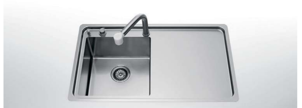
LFRS 587/1V1SL Lavello a una vasca e uno scivolo liscio, largo cm 87 LFRS 587/1V1SL Built-in sink with one bowl and one smooth draining-board, 87 cm wide