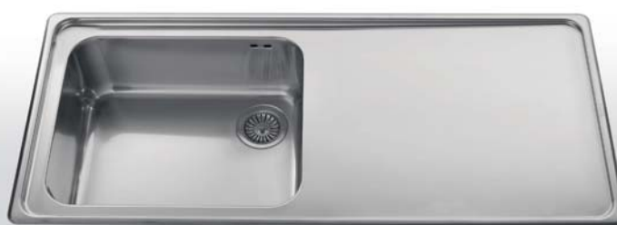
117/1V1SL Lavello da incasso ad una vasca ed uno scivolo liscio, largo cm 117 117/1V1SL Built-in sink with one bowl and one smooth draining-board, 117 cm width