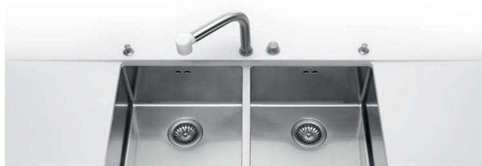
LSR 83/2V Lavello sottopiano raggio 12 a due vasche LSR 83/2V Undermount sink radius 12 with two bowls

Profondità Depth cm 40 Larghezza Width cm 83,5 Altezza Height cm 20