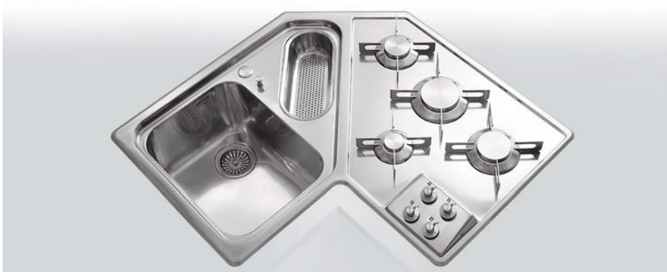
F 583/1V1B4G Piano lavaggio/cottura ad angolo a una vasca, una bacinella e quattro fuochi gas da incasso, largo cm 83,5 x 83,5 F 583/1V1B4G Built-in corner sink/hob unit with one bowl, one basin, and four gas burners, 83,5x 83,5 cm width