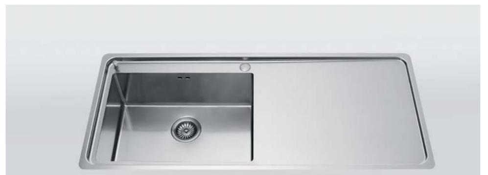
LFPS 5117/1V1SL Lavello a una vasca e uno scivolo liscio, largo cm 117 LFPS 5117/1V1SL Flush mount sink with one bowl and one smooth draining-board, 117 cm wide