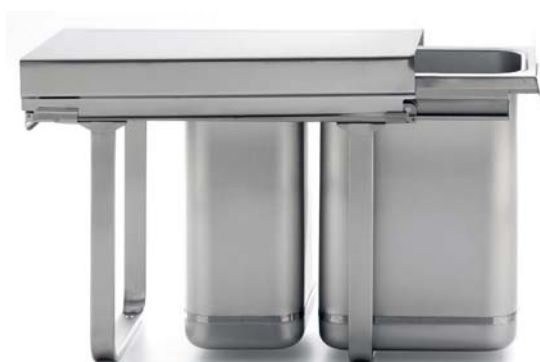
VERSIONE APPOGGIO A UN CONTENITORE PMR 34 Altezza cm 34 Litri 20

L'unità raccolta differenziata, il telaio, le guide telescopiche ad estrazione totale, i contenitori e tutti i componenti sono costruiti in acciaio inox Aisi 304 con satinatura argento. Il materiale che più garantisce la massima igienicità poichè non trattiene i batteri, non si scalfisce ed è facile da pulire. The waste sorting unit, the frame, the fully extendible telescopic guides, the containers and all the components are made of Aisi 304 stainless steel with silver satin finish. This material guarantees the highest degree of hygiene because it is scratch resistant and does not trap bacteria, and is easy to clean.