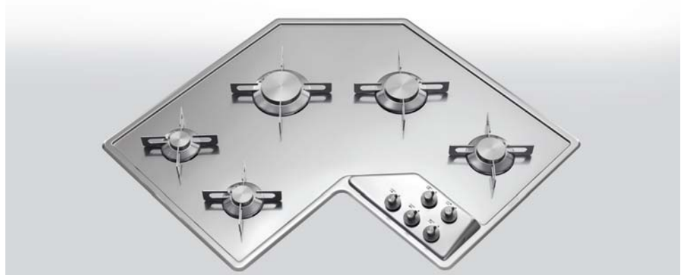
F 583/5G Piano cottura ad angolo a cinque fuochi gas da incasso, largo cm 83,5 x 83,5 F 583/5G Built-in corner hob with five gas burners, 83,5 x 83,5 cm width