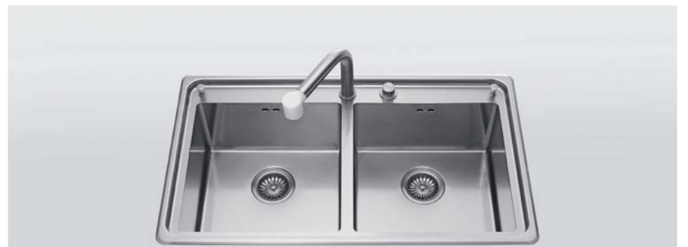
LFRS 587/2V Lavello a due vasche, largo cm 87 LFRS 587/2V Built-in sink with two bowls, 87 cm wide