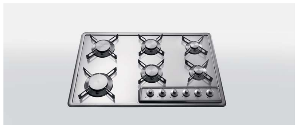
F 579/6G Piano cottura da incasso a sei fuochi gas, largo cm 79 F 579/6G Built-in hob with six gas burners, 79 cm wide