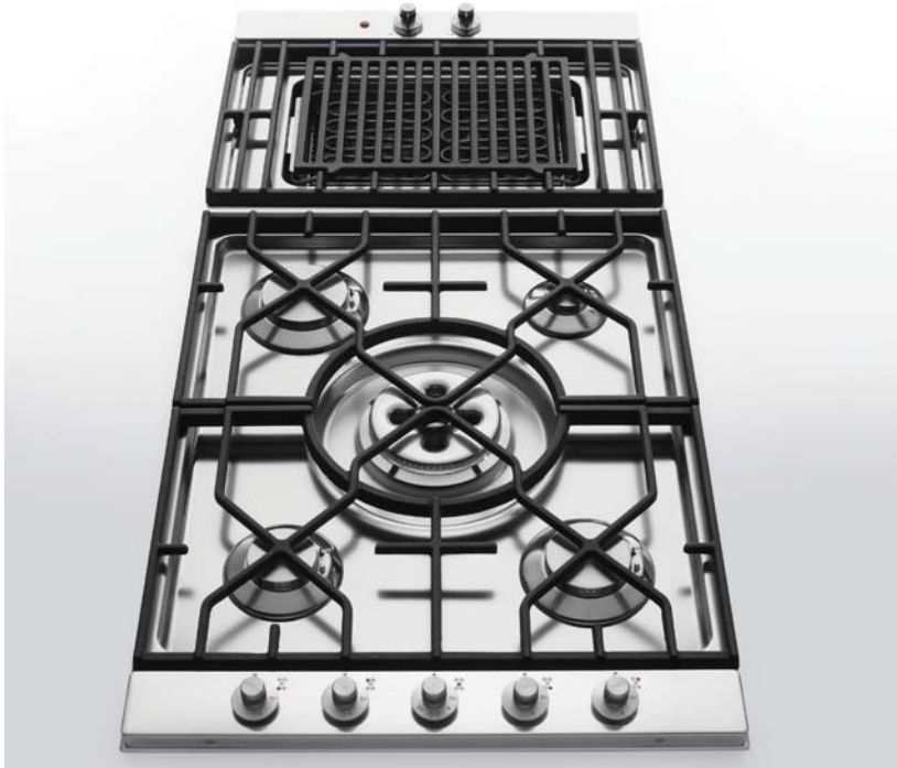
5641/GE-CL Grill elettrico con griglia in ghisa, largo cm. 41. 5674/4GTC-CL Piano cottura da incasso a cinque fuochi gas, tripla corona Dual, griglia in ghisa e comandi laterali, largo cm 74 5641/GE-CL Electric grill with cast iron grid, 41 cm wide. 5674/4GTC-CL Built-in hob with five gas burners, Dual triple crown burner, cast iron grid and side control knobs. Depth 74 cm

Piani cottura da incasso a gas e grill elettrico con griglie poggiapentola in ghisa. Built-in gas hob and electric grill with cast iron grid.