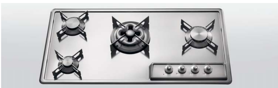
F 489/3GTC Piano cottura da incasso a quattro fuochi gas, largo cm 89 F 489/3GTC Built-in hob with four gas burners, 89 cm wide

Piano cottura incasso con cinque fuochi gas allineati e ben distanziati per ospitare pentole di grandi dimensioni. Posizionato al centro il bruciatore tripla corona Dual. Built-in hob with five gas burners in a line and set well apart for large pans. Dual triple crown burner at the centre.