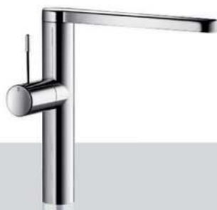
10.151.413.700 ONO Miscelatore monocomando con canna orientabile 10.151.413.700 ONO Mixing tap with integrated control and adjustable spout