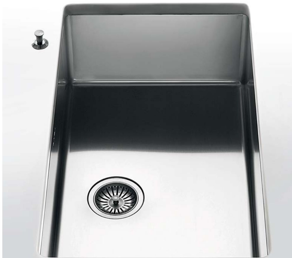
VSR 80 Vasca sottopiano larga cm 80 VSR 80 Undermount bowl 80 cm wide

Profondità Depth cm 40 Larghezza Width cm 34 - 40 - 50 - 70 - 80 Altezza Height cm 20