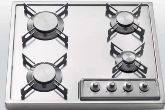
A 558/4G Piano cottura da appoggio a quattro fuochi gas, largo cm 58 A 558/4G Countertop hob with four gas burners, 58 cm wide