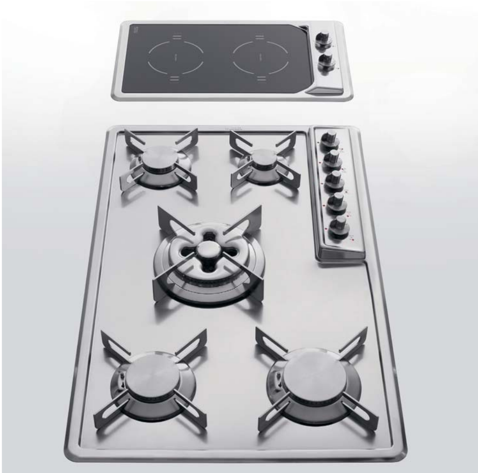
F 579/4GTC Piano cottura da incasso a cinque fuochi gas con bruciatore tripla corona Dual centrale, largo cm 79. F 530/2EI Piano a induzione con due zone cottura largo cm 30 F 579/4GTC Built-in hob with five gas burners, Dual triple crown burner at the centre, 79 cm wide F 530/2EI Electric induction hob with two cooking zones, 30 cm width

Profondità Depth cm 51 Larghezza Width cm 30 - 39 - 49 - 59 - 69 - 79 - 89 Altezza Height cm 4