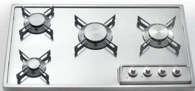
A 478/4G Piano cottura da appoggio a quattro fuochi gas, largo cm 78 A 478/4G Countertop hob with four gas burners, 78 cm width

Profondità Depth cm 45 Larghezza Width cm 78 - 88 - 98 Altezza Height cm 5