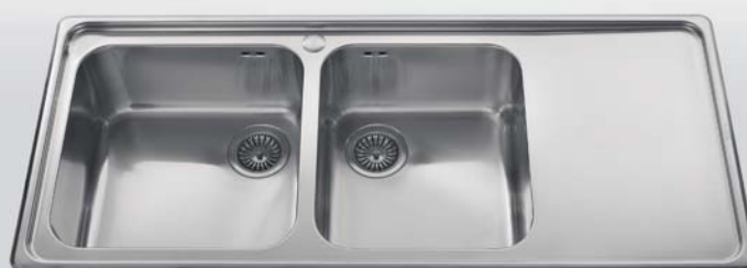
117/2V1SL Lavello da incasso a due vasche ed uno scivolo liscio, largo cm 117 117/2V1SL Built-in sink with two bowls and one flat draining-board, 117 cm width