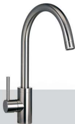
ALP 34 Miscelatore monocomando con canna orientabile ALP 44 Miscelatore monocomando con canna orientabile e doccino estraibile ALP 34 Mixing tap with integrated control and adjustable spout ALP 44 Mixing tap with integrated control, adjustable spout and pull-out spray