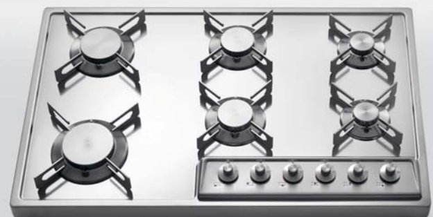
A 578/6G Piano cottura da appoggio a sei fuochi gas, largo cm 78 A 578/6G Countertop hob with six gas burners, 78 cm wide