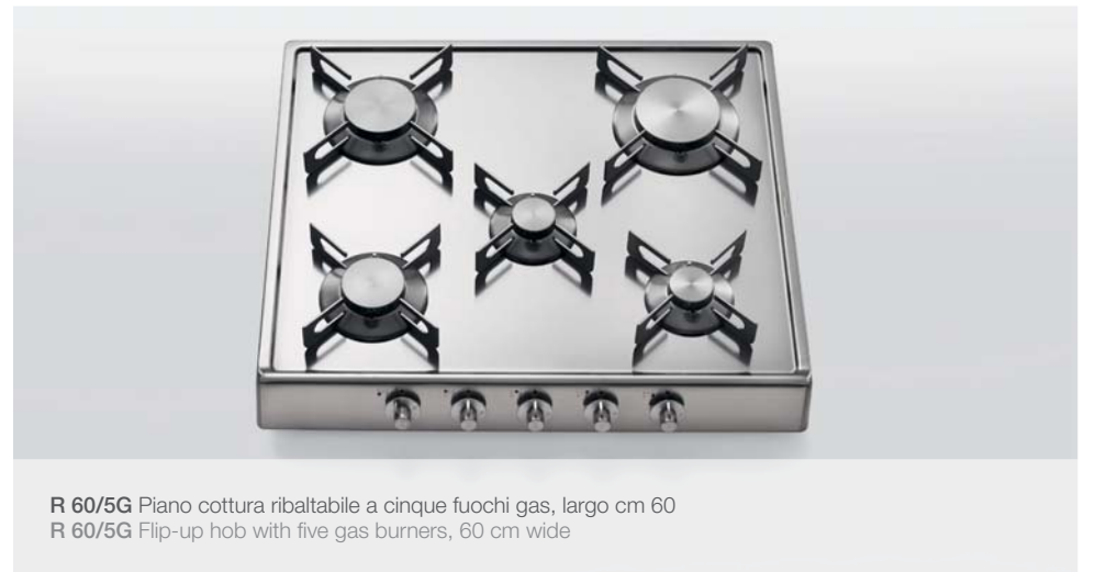
R 60/5G Piano cottura ribaltabile a cinque fuochi gas, largo cm 60 R 60/5G Flip-up hob with five gas burners, 60 cm wide