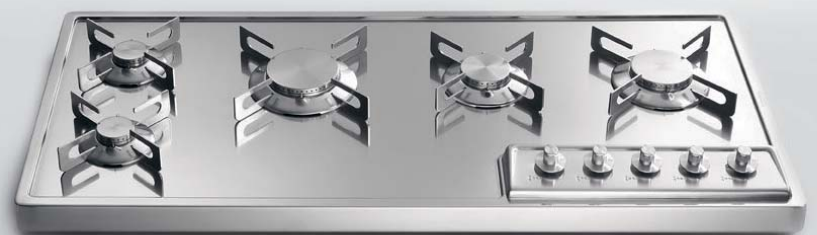
Tre importanti fuochi in linea e due fuochi piccoli abbinati per pesciere o singoli utilizzi. A 498/5G Piano cottura da appoggio a cinque fuochi gas, largo cm 98 Three large aligned burners and two small burners to use together under a fish poacher or individually. A 498/5G Countertop hob with five gas burners, 98 cm width