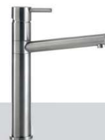
ALP 33 Miscelatore monocomando con canna orientabile ALP 33 Mixing tap with integrated control and adjustable spout