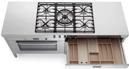
Piano cottura con cinque fuochi a gas, griglia in ghisa, comandi frontali, top inox. Grande forno elettrico e cassetti attrezzati. Hob with five gas burners, cast iron grids, front controls, stainless steel countertop. Large electric oven and accessorized drawers.