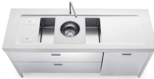
Vasca sottopiano, top in Corian®, due cassetti e anta per lavastoviglie inox, raccolta differenziata. Undermounted sink, Corian® countertop, two drawers and one dishwasher panel in stainless steel, separated waste disposal system.