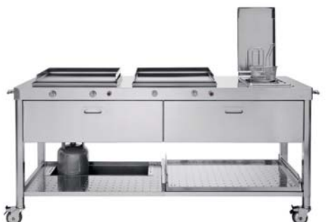
Carrello con top inox, piastra cottura inox a gas, friggitrice, due cassetti inox, ripiano estraibile e porta bombola. Trolley with stainless steel countertop, one stainless steel gas plancha, fryer, two stainless steel drawers, a pull-out shelf and gas cylinder storage.