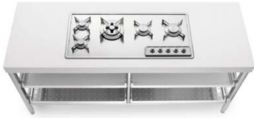
Piano cottura ad incasso con cinque fuochi a gas in linea e quattro ripiani estraibili inox. Built-in hob with five aligned gas burners and four stainless steel pull-out shelves.