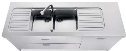
Lavello integrato al top inox con due vasche e due scivoli, due cassetti e anta per lavastoviglie inox. Sink integrated into the stainless steel countertop with two bowls and two draining-boards, two drawers and a dishwasher panel in stainless steel.