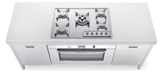
Piano cottura ad incasso con cinque fuochi a gas, top in Corian®, grande forno elettrico, due ante inox. Built-in hob with five gas burners, Corian® countertop, large electric oven, two stainless steel doors.