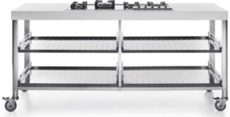
Piano cottura ad incasso e quattro ripiani estraibili inox. Built-in hob and four stainless steel pull-out shelves.