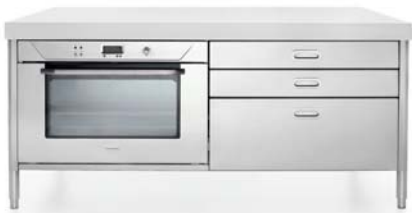
Forno elettrico multifunzione con porta fredda, tre cassetti inox. Multifunction cold-door electric oven, three stainless steel drawers.