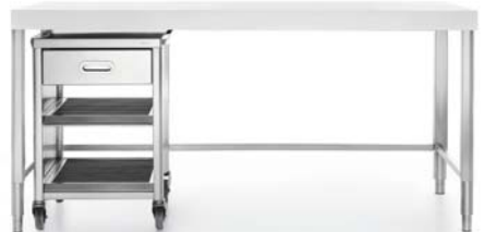
Carrello sotto top con un cassetto e due ripiani estraibili inox. Trolley under the counter with one drawer and two pull-out shelves in stainless steel.