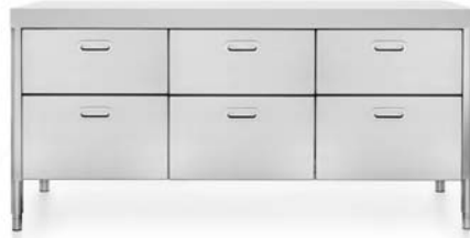
Top in Corian®, sei cassetti inox. Corian® countertop, six stainless steel drawers.