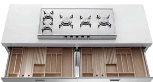
Piano cottura ribaltabile con cinque fuochi a gas in linea, top in Corian®, cassetti attrezzati. Flip-up hob with five aligned gas burners, Corian® countertop, accessorized drawers.