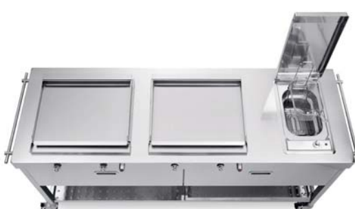
Carrello con top inox, due piastre cottura inox a gas, friggitrice elettrica. Trolley with stainless steel countertop, two stainless steel gas planchas, electric fryer.