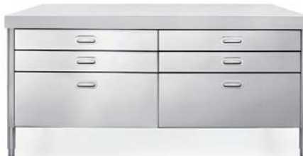
Top in Corian®, sei cassetti inox. Corian® countertop, six stainless steel drawers.