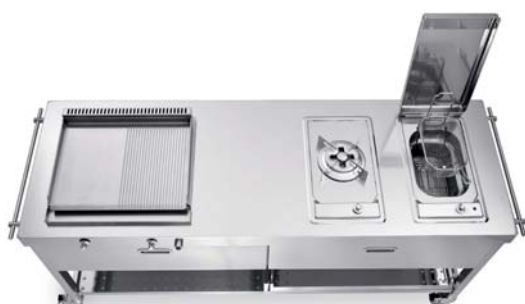
Carrello con top inox, piastra cottura inox a gas, piano cottura fuoco singolo con tripla corona, friggitrice elettrica. Trolley with stainless steel countertop, stainless steel gas plancha, hob with one gas triple-crown burner, electric fryer.