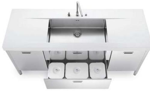
Vasca sottopiano, top in Corian®, due ante e due cassetti inox, raccolta differenziata. Undermounted sink, Corian® countertop, two stainless steel doors and drawers, separated waste disposal system.