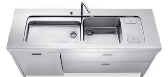
Lavello integrato al top inox con raccolta differenziata dall'alto, due cassetti e anta per lavastoviglie inox. Sink integrated into the stainless steel countertop with separated waste disposal from above, two drawers and a dishwasher panel in stainless steel.