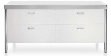
Top inox, quattro cassetti in laccato bianco. Stainless steel countertop, four painted-white wood drawers.