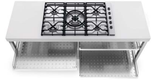
Piano cottura ad incasso con cinque fuochi a gas, griglia in ghisa, comandi laterali e quattro ripiani estraibili inox. Built-in hob with five gas burners, cast iron grids, side controls and four stainless steel pull-out shelves.