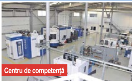
Centru de competență

Autonova poate face față cu succes concurenței oricăror corporații, luând în calcul aspecte precum resursa umană de o excelentă calitate, personalul calificat și cu experiență îndelungată dobândită în lunga istorie relevantă a companiei. Această experiență este dublată de susținerea tinerilor colegi care, alături de elanul specific, beneficiază și de cunoștințele tehnice și de afaceri dobândite în timp de către companie. Dotările de ultima generație realizate ca urmare a proiectelor investiționale consistente, un sediu și o platformă industrială integral renovate în urma proiectului de modernizare realizat în anul 2017 vin să completeze principalele avantaje pe care compania le deține.