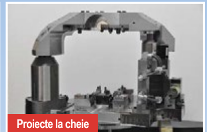
Proiecte la cheie