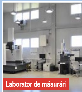
Laborator de măsurări