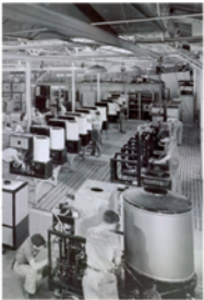
Production line 1940

Der 20. Oktober 1930, war nicht die beste Zeit in der Geschichte um ein neues Unternehmen zu gründen. In der Zeit der großen Rezession