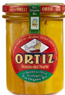
Bonito del Norte en Aceite de Oliva Virgen Extra Ecológico Tarro 150 grs. escurridos