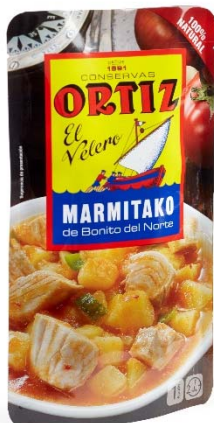
Caja de 12 EAN: 8411320892701