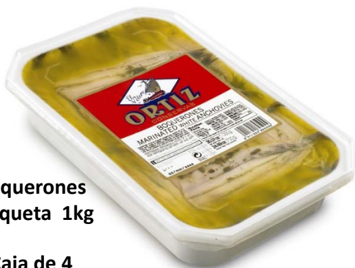
Boquerones barqueta 1kg