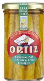
Filetes de caballa en Aceite de Oliva Virgen Extra Ecológico Tarro 165 grs. escurridos