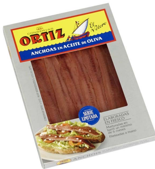
Anchoa Serie Limitada Tamaño grande (8 filetes) Caja de 15 EAN: 8411320102060