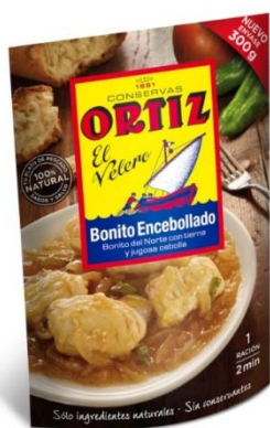
Caja de 9 EAN: 8411320892770

El Bonito encebollado Receta tradicional, que une la textura suave del Bonito del Norte y el sabor intenso de la cebolla.