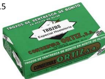
Trozos de ventresca de bonito "Trozos" OL-120 Caja de 24 EAN: 8411320269008