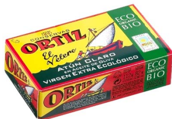
Atún Claro en Aceite de Oliva Virgen Extra Ecológico Lata estuchada 82 grs. escurridos