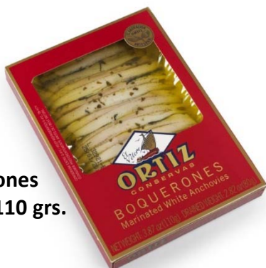
Boquerones barqueta 110 grs.