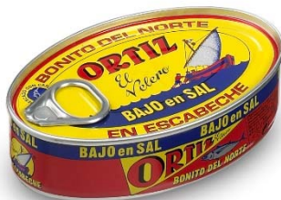
OL- 120 en escabeche bajo en sal Caja de 30 EAN: 8411320224038