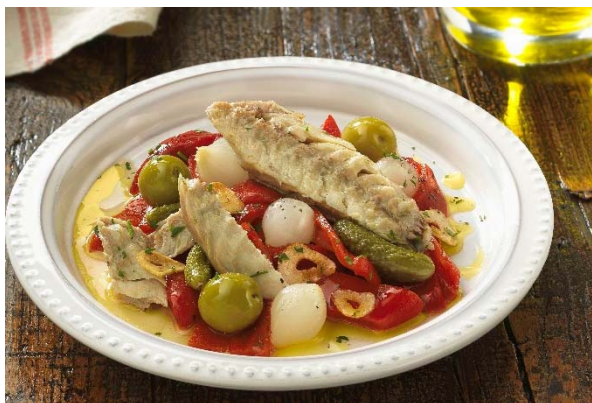
Ensalada de Chicharro con encurtidos

Ahora también en un innovador envase “pouch”, más fácil de abrir y muy sabroso, que contiene dos chicharros enteros. Ideal para preparar recetas frías o calientes.