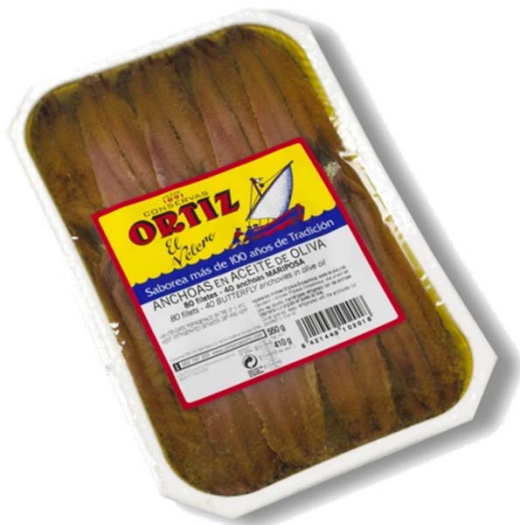
Anchoa Mariposa ESPECIAL" 80 Filetes Caja de 8 EAN: 8411320102008