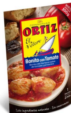
Caja de 9 EAN: 8411320892749

Bonito del Norte En salsa de tomate y pimientos Tiernos y jugosos lomos de Bonito del Norte unidos a una exquisita salsa de tomate y pimientos.