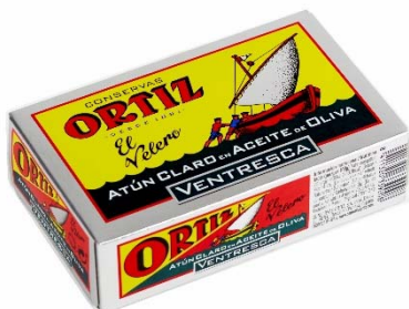
Ventresca de Atún Claro OL-120 Caja de 24 EAN: 8411320339008

La ventresca es la parte más suave y delicada del Bonito del Norte. La presentamos en finos filetes en aceite de oliva.