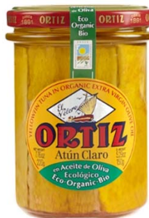
Atún Claro en Aceite de Oliva Virgen Extra Ecológico Tarro 150 grs. escurridos