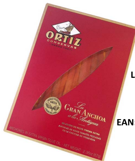
La Gran Anchoa

Pescadas durante la Costera con artes tradicionales de pesca, las anchoas se clasifican por tamaño, se descabezan manualmente y se ponen a madurar en barriles con sal y prensa. El tiempo de maduración en bodega es uno de los factores de intensidad del sabor y la textura de la anchoa. Nuestras anchoas pasan como mínimo 6 meses madurando y una vez alcanzado el nivel deseado, ya sólo queda filetearlas a mano y envasarlas en aceite de oliva.