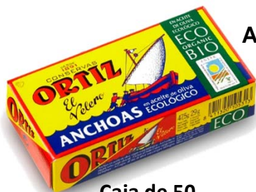
Anchoas en Aceite de Oliva Virgen Extra Ecológico 29 grs. escurridos