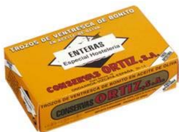
Ventresca de bonito Enteras OL-120 estuche naranja Caja de 24 EAN: 8411320269015

Conservas Ortiz ofrece la parte más fina y delicada del atún claro: la ventresca. La envasamos en finos filetes en aceite y es un auténtico manjar listo para ser degustado