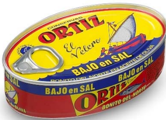
OL- 120 en aceite bajo en sal Caja de 30 EAN: 8411320234037