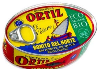
Bonito del Norte en Aceite de Oliva Virgen Extra Ecológico Lata 82 grs. escurridos