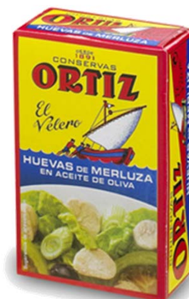
Caja de 24 EAN: 8411320894101

Exquisitas Huevas de Merluza con un sabor suave y una delicada textura. Las envasamos en aceite de oliva y son perfectas para ser degustadas en tapa o en ensalada.