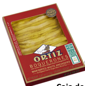
Boquerones con Aceite de Oliva Virgen Extra Ecológico 80 grs. escurridos