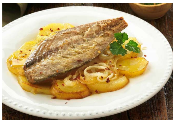
Chicharro templado con patata panadera