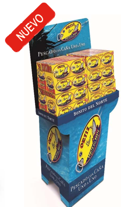
Peana bipack ovals y ovals Bonito