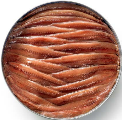
Caja de 6

Filetes de anchoas Ortiz Serie Oro RO-550