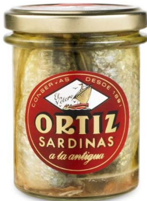
Sardinas a la Antigua Cristal