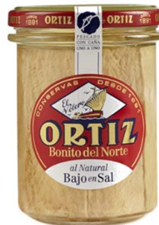
Tarro RO-260 alto al natural bajo en sal Caja de 12 EAN: 8411320284964

Existen 3 variedades de Bonito del Norte Bajo en Sal: en Aceite de Oliva, en Escabeche y Al Natural.