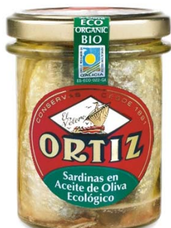
Sardinas en Aceite de Oliva Virgen Extra Ecológico Tarro 140 grs. escurridos