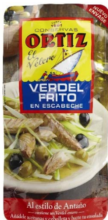
Pouch verdel Tamaño grande