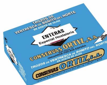
Ventresca de bonito Enteras OL-120 estuche azul Caja de 24 EAN: 8411320269022