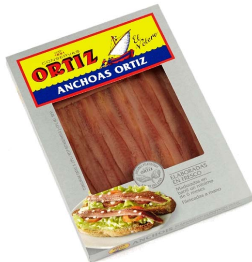
Barqueta Anchoa Alimentación Caja de 15 EAN: 8411320102077