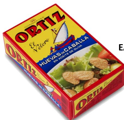
Caja de 24 EAN: 8411320739006

Envasamos las Huevas de Caballa en aceite de oliva a las que añadimos guindilla Cayena que las hace ligeramente picantes.