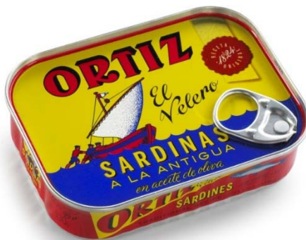
Sardinas a la Antigua RR-150

Las sardinas de la variedad Sardina Pilchardus están elaboradas en fresco y "A la Antigua". Se limpian a mano, una a una , y se fríen en aceite de Oliva Virgen. Las Sardinas en conserva, al igual que el Bonito del Norte, mejoran su sabor con los años, haciéndose más melosas y delicadas . Al igual que el vino, se puede crear una bodega de Conservas de Bonito del Norte y de Sardinas, que mejorarán su calidad y su sabor con el tiempo.