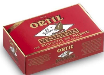
Ventresca de Bonito OL-120 Caja de 24 EAN: 8411320239001