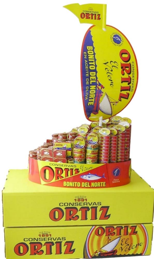
Barca con cubre palet