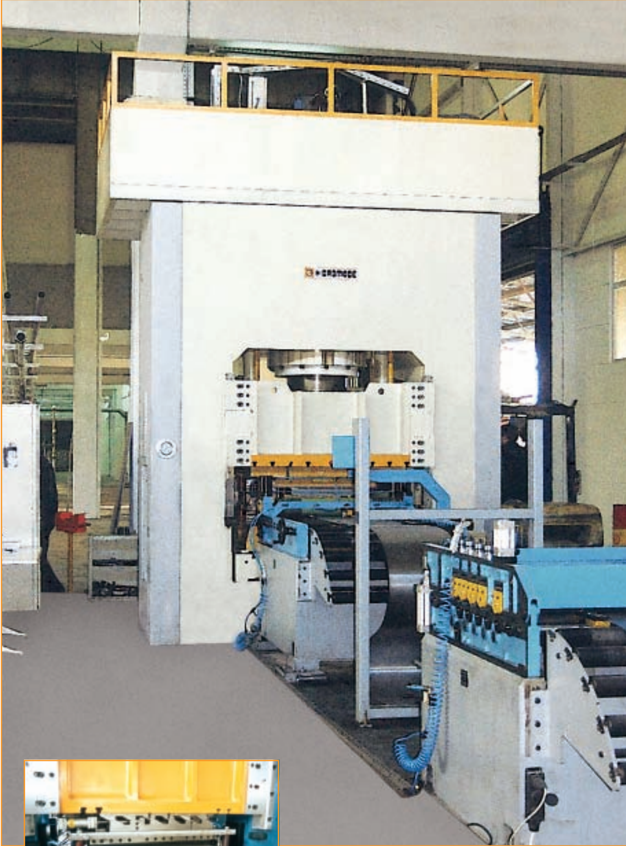
630 Ton Yüksek Hızlı Radyatör Panel Presi 630 Tons High Speed Radiator Panel Press