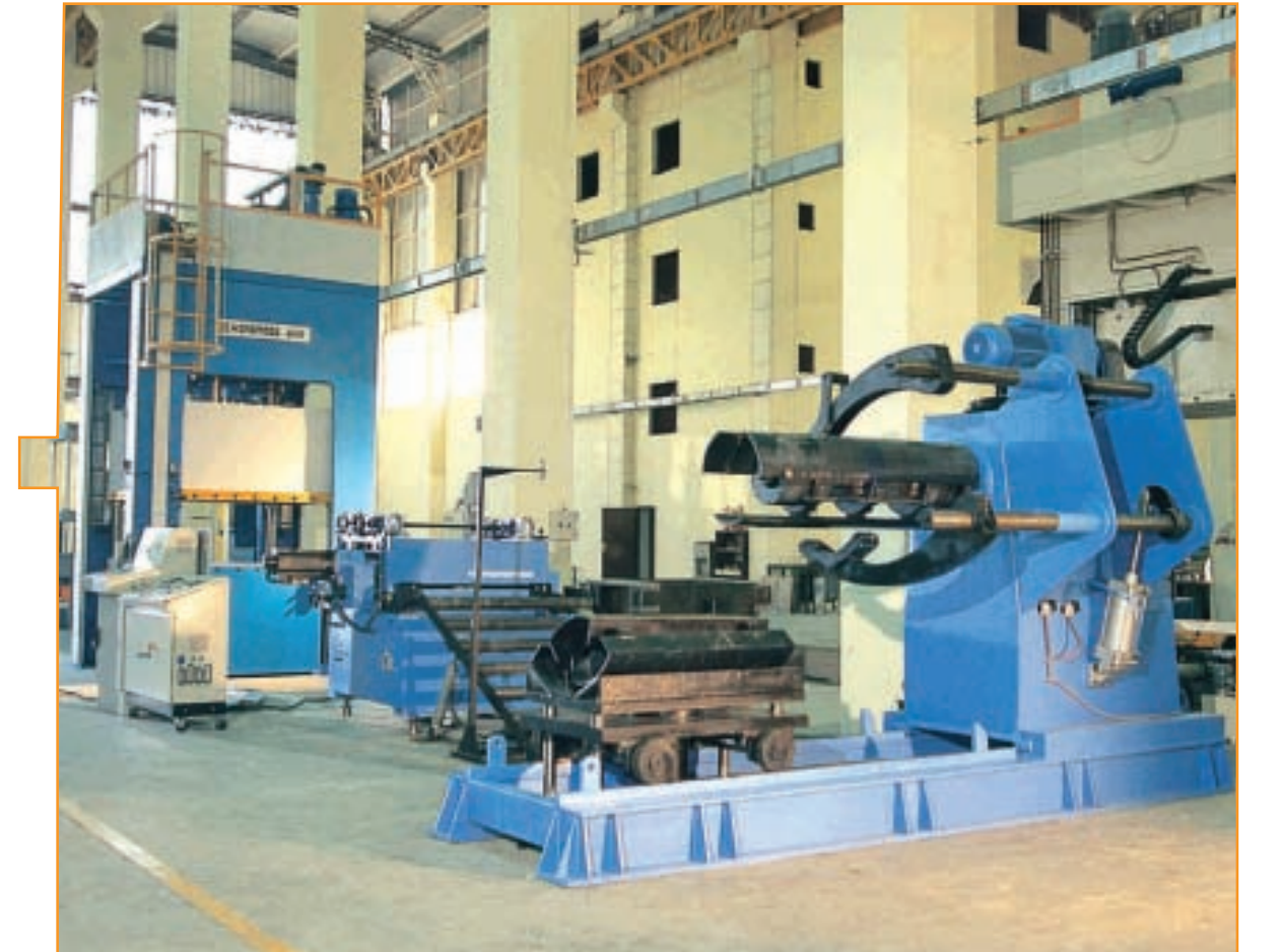
LPG tüp pul kesme hattı Rondel cutting line for LPG tubes