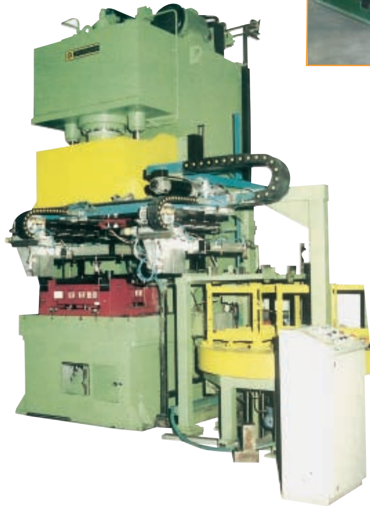
Aygaz C Form Katalitik Soba Üretimi Özel Presi Special C Form Press for Manufacturing Catalytic Oven