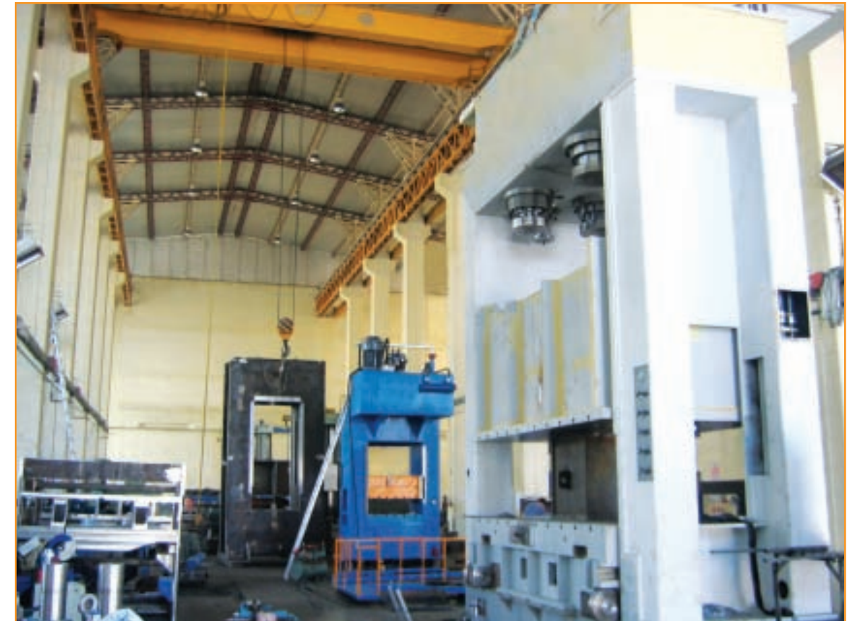
Pres Montaj Holü Press Assembly Hole