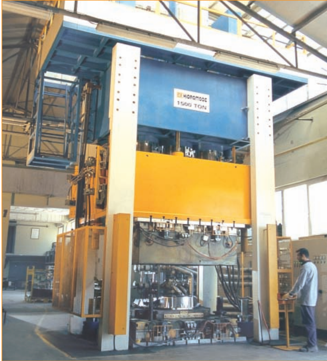
Avitaş 1500 ton paralelitem kontrollü polyester presi Avitaş 1500 tones parallelity controlled polyester press