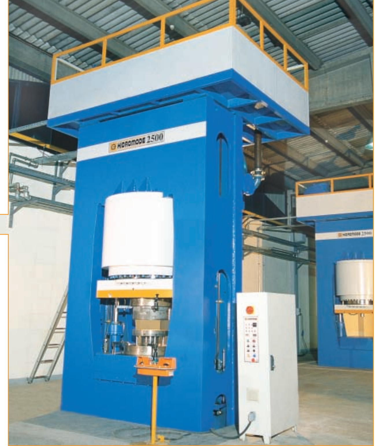
AL-CO 2500 ton alüminyum friksiyon presleri AL-CO 2500 tones aluminium friction press