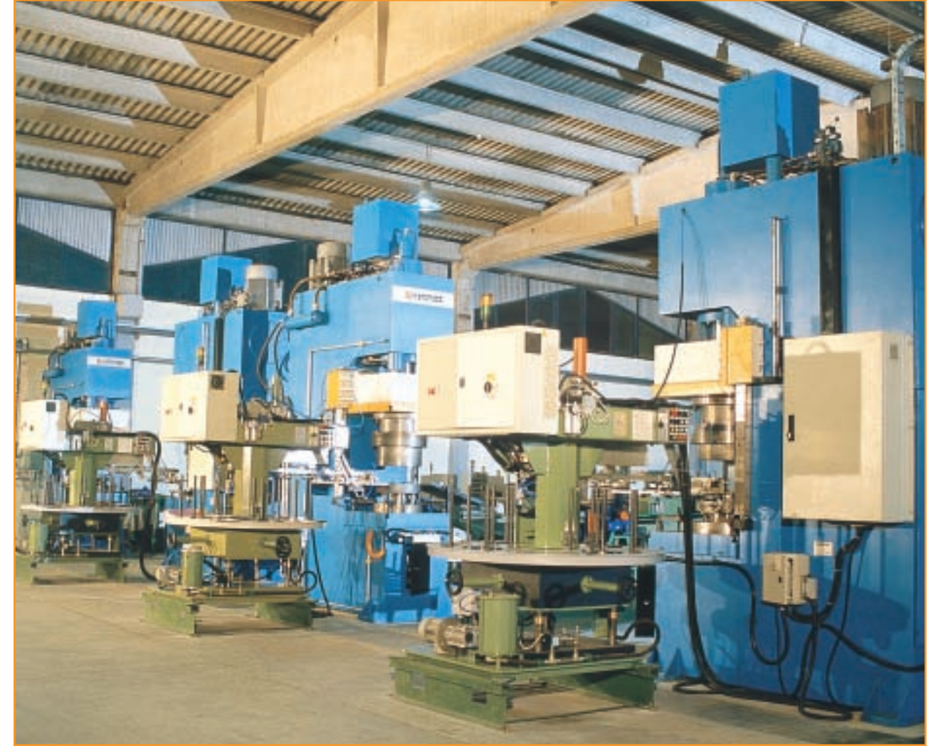
AL-CO teflon tencere pres hattı AL-CO teflon saucepan press line