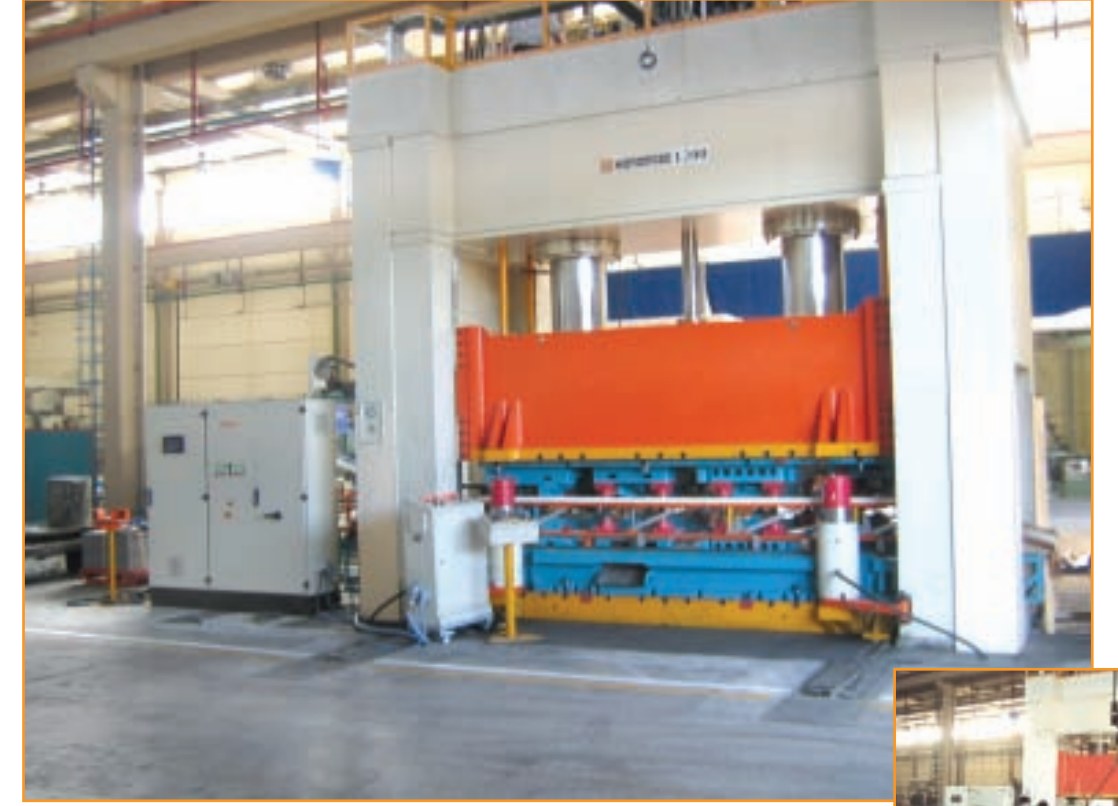
Erkalıp HSP-D 1200 / 4x90 Kayar Tablalı Hidrolik Pres Erkalıp HSP-D 1200 / 4x90 Hydraulic Press with Moving Bolster