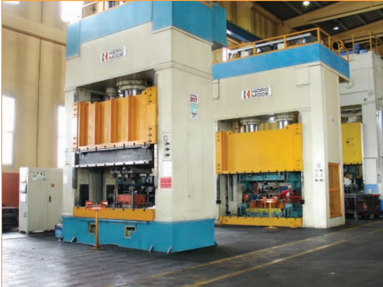
Şahinkul Hidrolik Derin Çekme ve Form Verme Pres Hattı Şahinkul Hydraulic Deep Drawing and Forming Presses Line