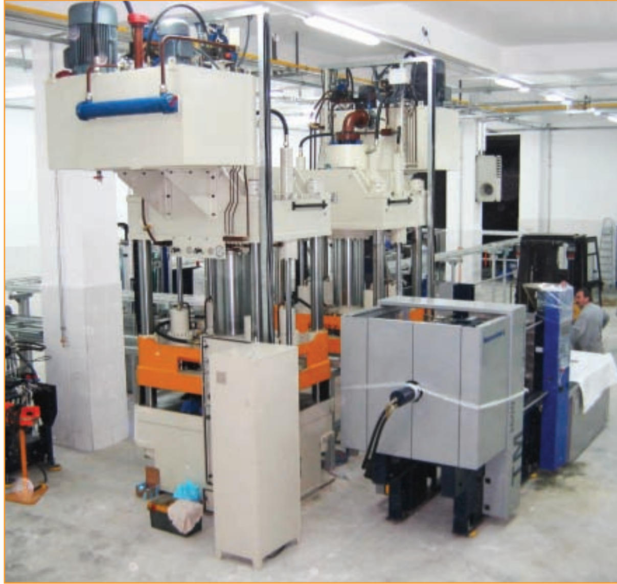
Pressan HSP 350/150 - 1260x915 Kolonlu Pres Hattı Pressan HSP 350/150 - 1260x915 Tie Rod Press Line