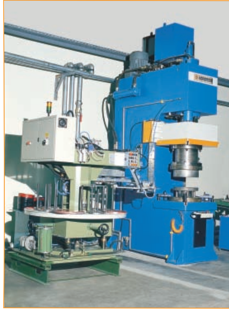
C-FORM teflon tencere presi C-FORM teflon saucepan press