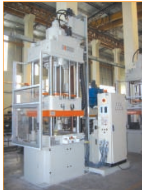
Siemens SMC Transfer Presi Siemens SMC Transfer Press