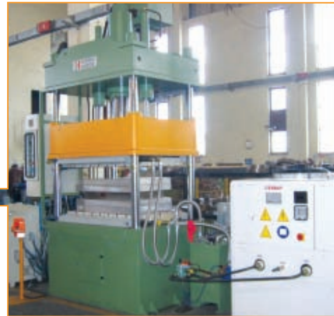
TAI RTM Presi TAI RTM Press