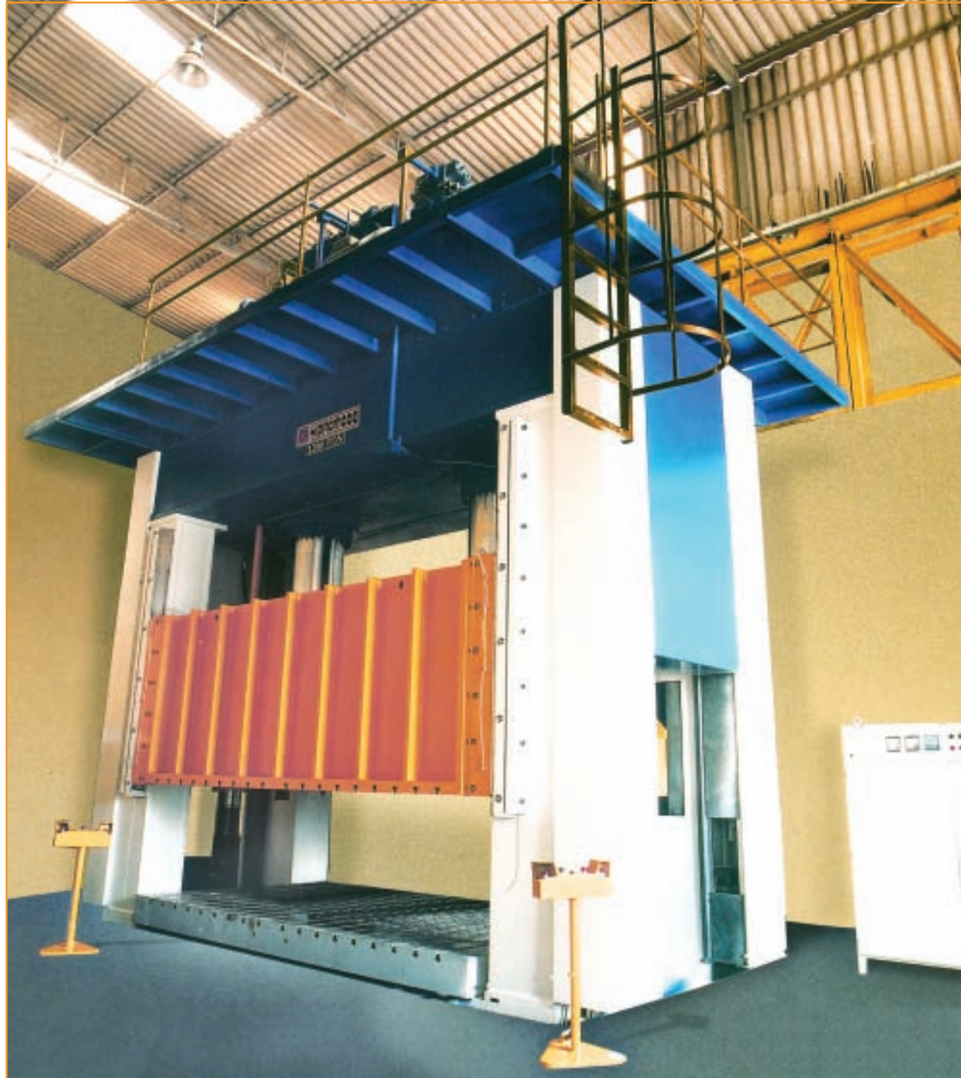
Özbekistan Samkoç Iveco HSP-D 1200/400 , Tabla Ebadı 2000 x 4200 Uzbekistan Samkoç Iveco HSP-D 1200/400 , Table Size 2000 x 4200