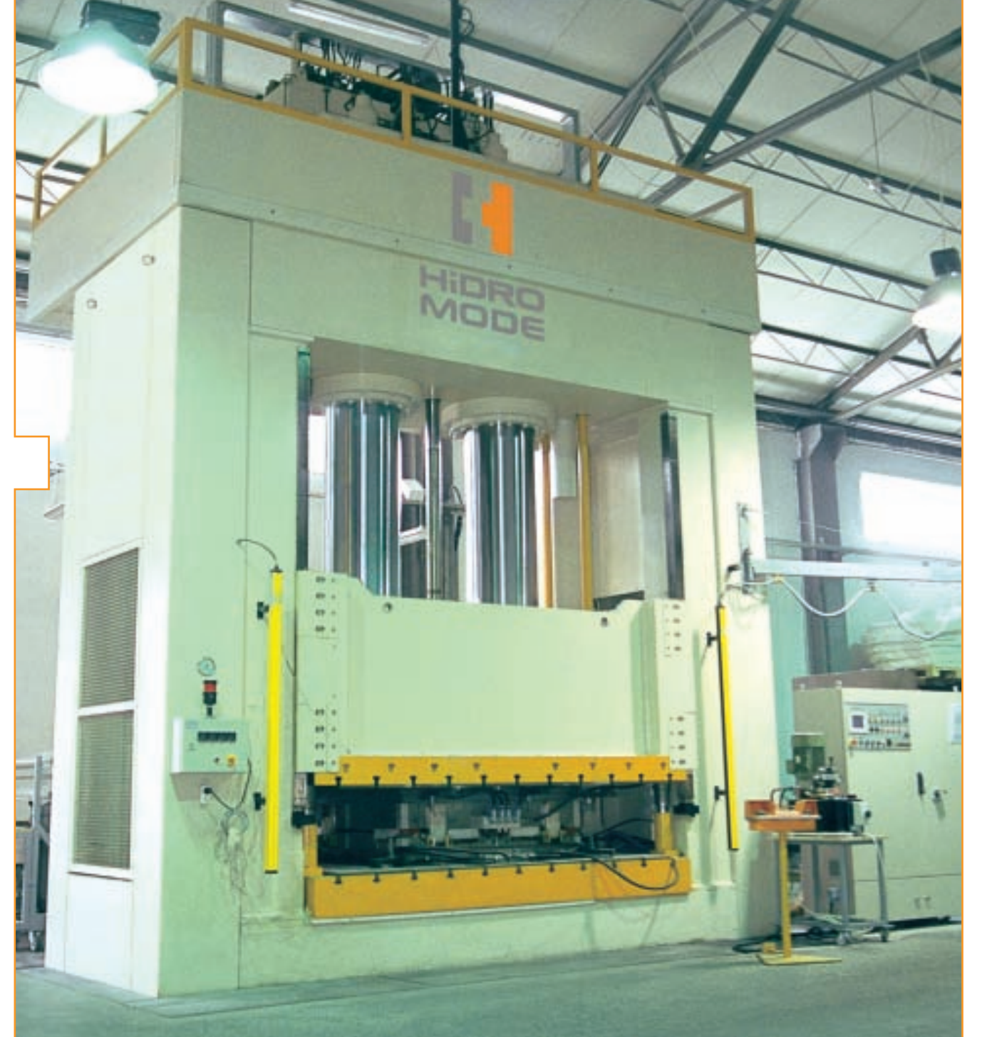
C.F. Maier 1000 ton polyester pres C.F. Maier 1000 tones polyester press