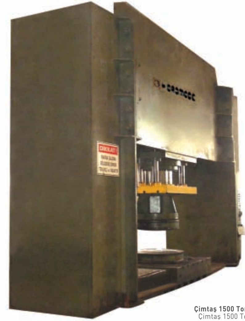
Çimtaş 1500 Ton Bombe Presi Çimtaş 1500 Tons Dish Press