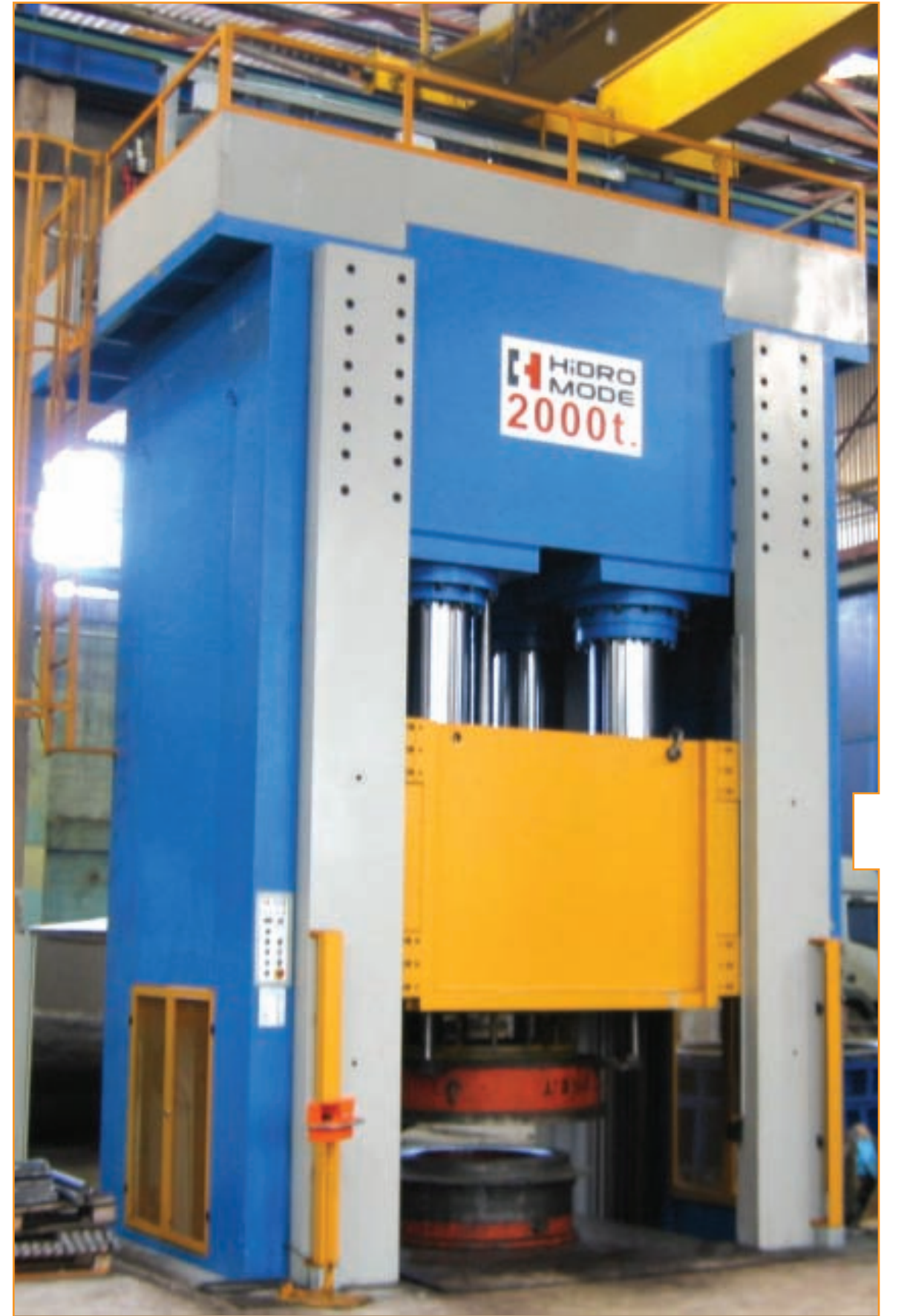
Kartal Bombe HSP-DM 2000/1000 Hidrolik Pres Kartal Bombe HSP-DM 2000/1000 Hydraulic Press