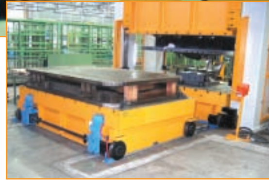
Mercedes-Benz HSP-DM 630 / 240 Çift Kayar Tablalı Hidrolik Pres Mercedes-Benz HSP-DM 630 / 240 Double Moving Bolster Hydraulic Press