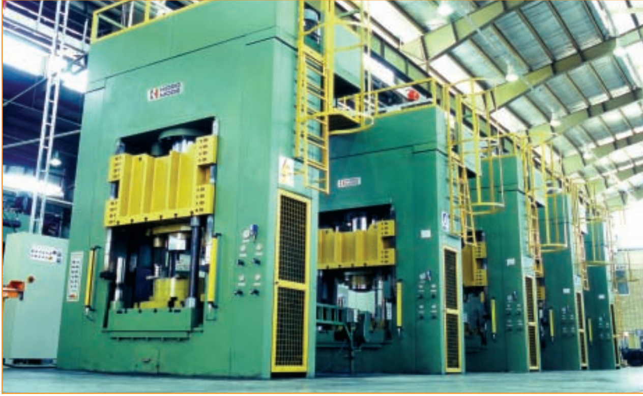
Ar-Machine Co. Jant Üretim Hattı Ar-Machine Co. Wheel Rim Manufacturing Line