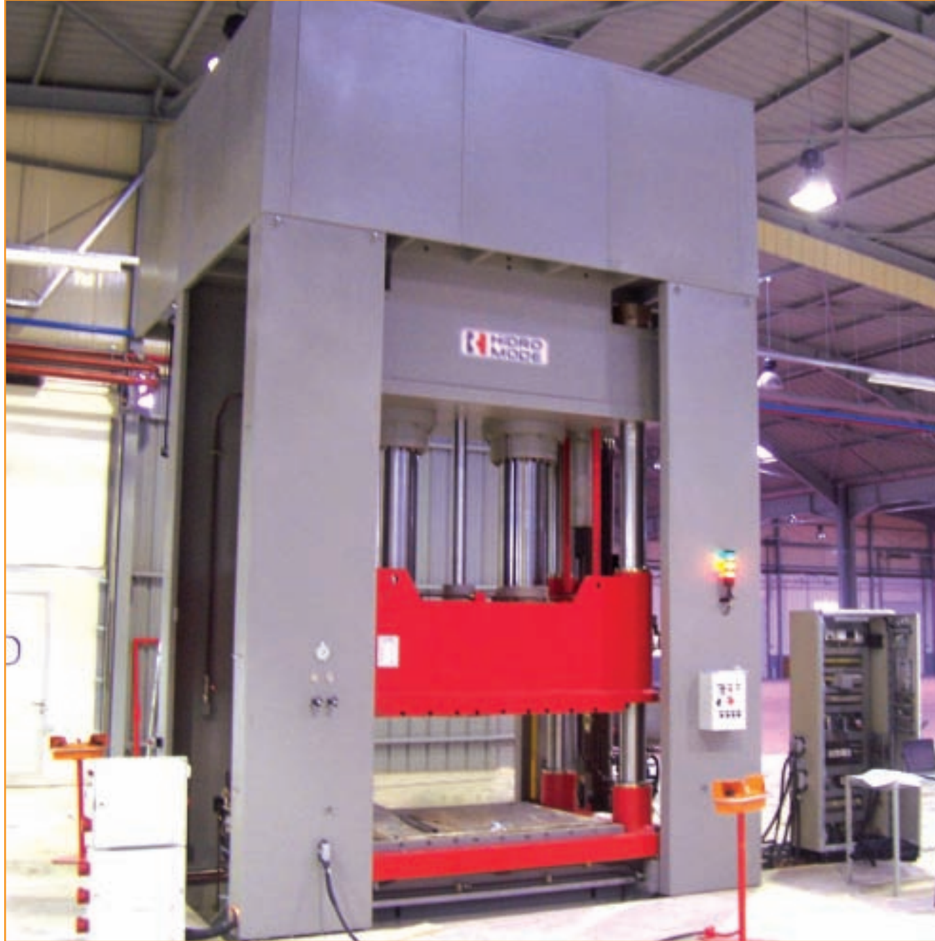
Cahors Group Oge Marocc 600 Ton Kolonlu SMC Presi Cahors Group Oge Marocc 600 Tons Tie Rod SMC Press