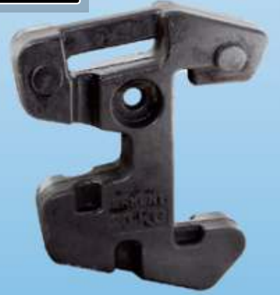
MYE 402 / Erkunt 58nlik Ön Çanta