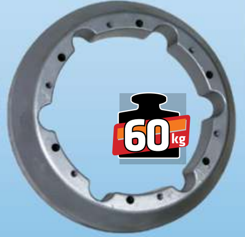
MYE 112 / MF AGCO Arka Teker