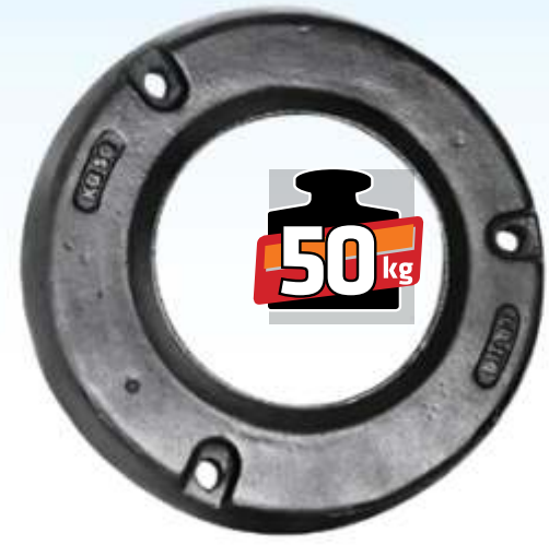
MYE 208 / NewHolland TD Arka Teker