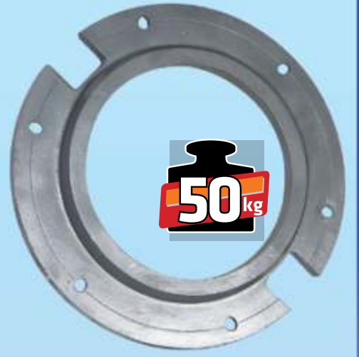
MYE 117 / MF 135 Arka Teker