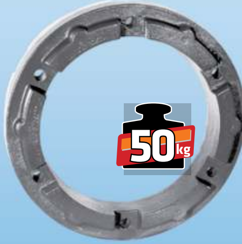
MYE 113 / MF AGCO Arka Teker