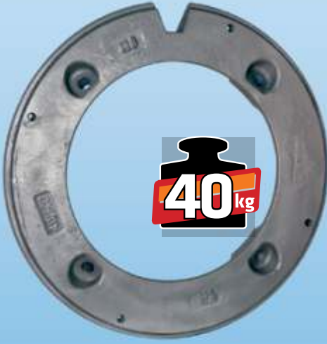
MYE 118 / MF 240 iç