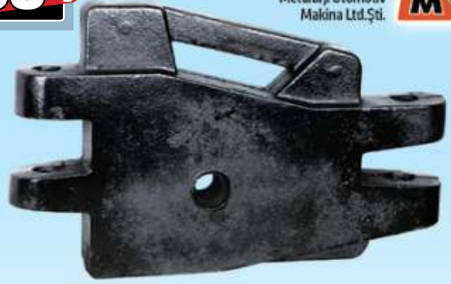
MYE 115 / MF AGCO Kurt Ağzi