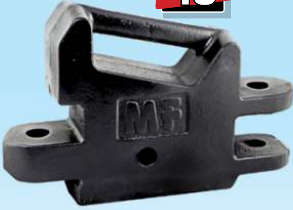
MYE 111 / MF Kurt Ağzi