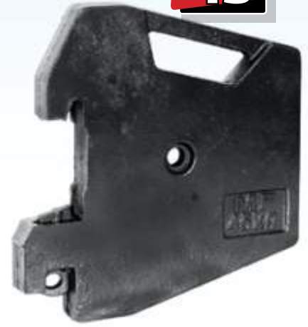
MYE 121 / MF 3065 Ön Çanta