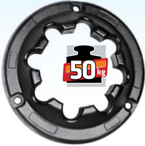
MYE 212 / NewHolland TT 4 Arka Teker