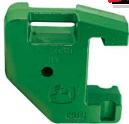
MYE 501 / JohnDeere Bahçe 5085 Ön Çanta