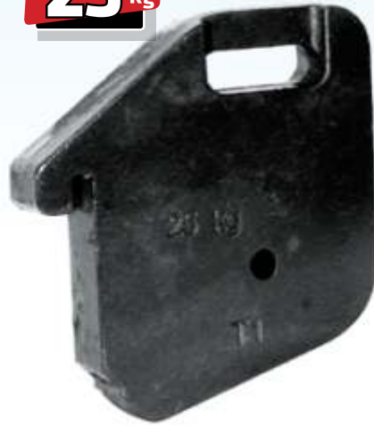
MYE 127 / MF 240 Ön Çanta Y.M.