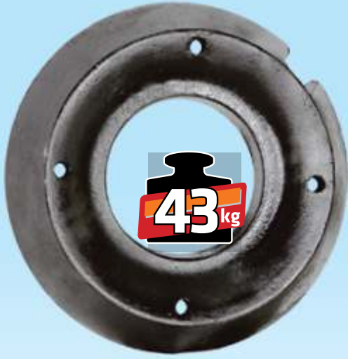
MYE 128 / MF İnce Arka Teker