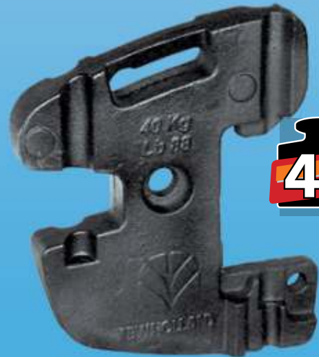
MYE 213 / NewHolland TD Ön Çanta Delikli