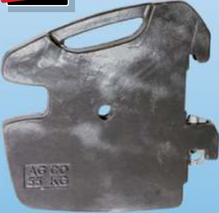
MYE 114 / MF AGCO Ön Çanta