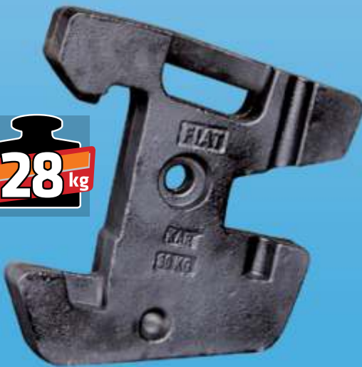
MYE 202 / Fiat Ön Çanta Yeni Model