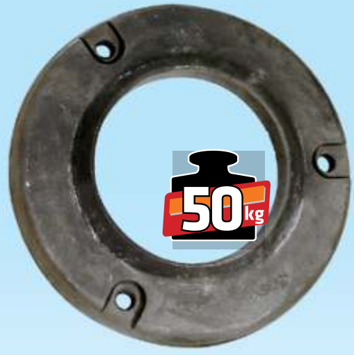
MYE 302 / Tümosan Arka Teker