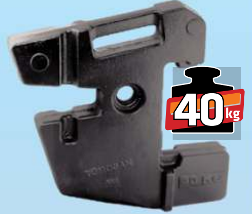
MYE 401 / Erkunt Ön Çanta