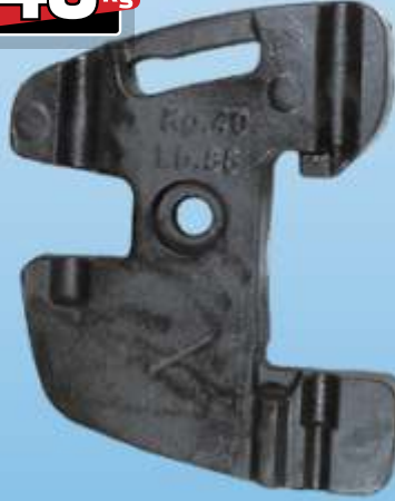
MYE 204 / NewHolland TD Ön Çanta