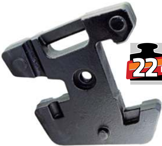
MYE 201 / Fiat Ön Çanta