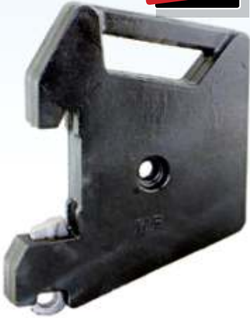
MYE 110 / MF Ön Çanta