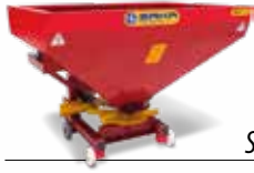
Tek Diskli Gübre Serpme Makinaları Single Disc Fertilizer Spreaders