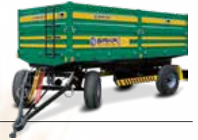
Çift Dingil Römorklar Double Axle Trailers