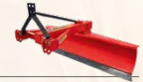
Tesviye Küreği Levelling Blade