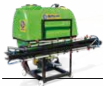
Tarla Tip İlaçlama Makinası (Pülverizatör) Field Type Spraying Machine