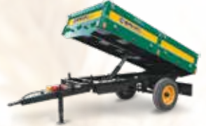
Tek Dingil Römorklar Single Axle Trailers