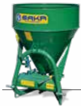
Yuvarlak Tip, Tek Diskli Gübre Serpme Makinaları Round Type Single Disc Fertilizer Spreaders