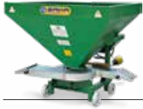
Gübre ve Kükürt Serpme Makinaları Fertilizer and Sulphur Spreaders