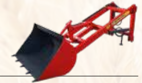
Traktör Arka Yükleyici Tractor Rear Loader