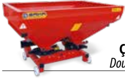
Çift Diskli Gübre Serpme Makinaları Double Disc Fertilizer Spreaders