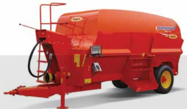
SAMURAI 7 450/110