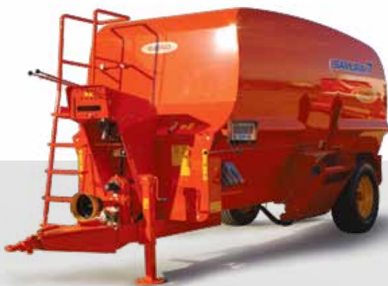
SAMURAI 7 500/150

Sistema brevettato di trinciatura-miscelazione "Double Mix" a 2 coclee inferiori con elevata rapidità e precisione di lavoro