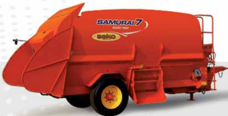
SAMURAI 7 500/150 WITH LOADING SHOVEL