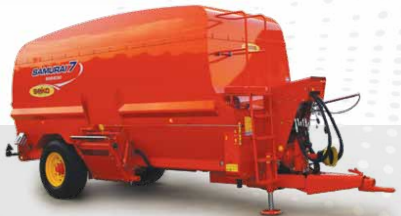
SAMURAI 7 600/230