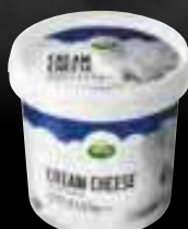
Cream Cheese 25% M.G. SEAU DE 1,5 KG