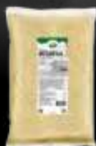
Mozzarella Cossettes SACHET 2KG