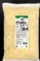
Mozzarella Rapée SACHET 2KG

Pizzas, Panini, Croques et autres sandwichs chauds