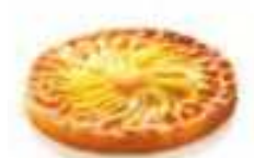
Nappage et miroir