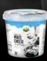
Dés de Fromage à l'huile Epices et Aromate 1,6 kg (1KG POIDS NET)