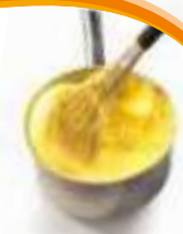
Crème pâtissière à chaud